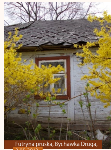
Futryna pruska, Bychawka Druga, 2.05.2013

W okolicach Bychawy występowały wyłącznie dachy dwuspadowe. W miejscowościach Olszowiec oraz Bychawka Pierwsza natrafiono na dwie chałupy posiadające dach naczółkowy, będący formą pośrednią pomiędzy dachem czterospadowym a dwuspadowym, powstał w skutek ścięcia górnych części szczytów i wyodrębnienia w nich niewielkich trójkątnych połaci . Powszechna na omawianym terenie była konstrukcja krokwiowa więźby dachowej. Dawniej chałupy pokrywano strzechą. Z czasem zaczęto powszechnie stosować eternit lub tzw. drobny eternit oraz papę i blachę. Niekiedy dachy kryto także tzw. dachówką poniemiecką.