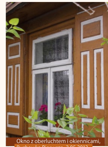
Okno z oberluchtem i okiennicami, Bychawka Pierwsza, 2.05.2013