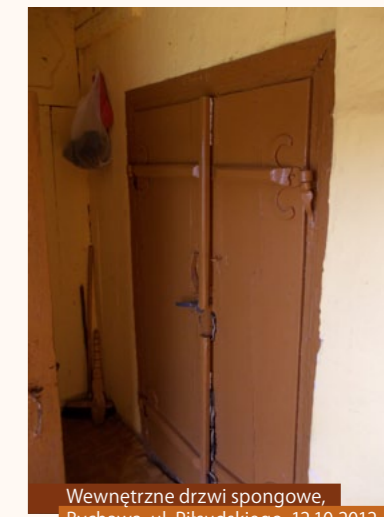
Wewnętrzne drzwi spongowe, Bychawa, ul. Piłsudskiego, 12.10.2012