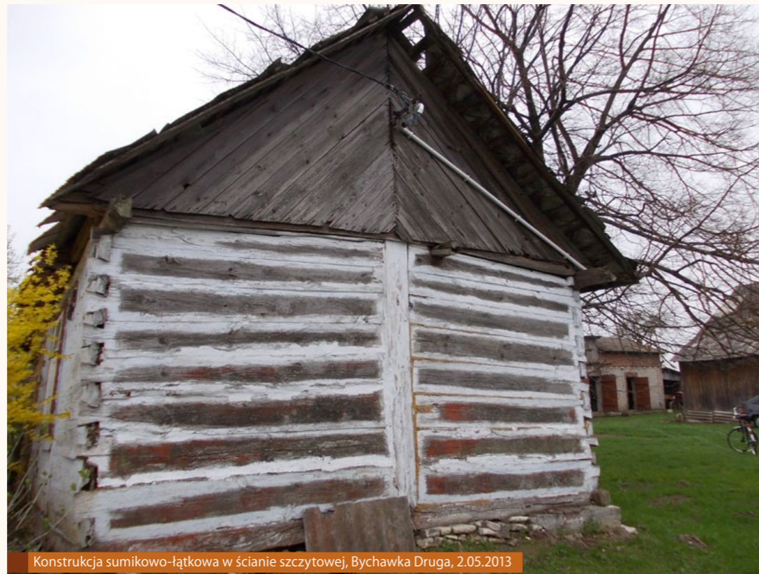
Konstrukcja sumikowo-łątkowa w ścianie szczytowej, Bychawka Druga, 2.05.2013

W budynkach zwykle stosowana była konstrukcja wieńcowa (zwana także zrębową lub budowaniem na węgiel), którą często łączono z sumikowo-łątkową. Pierwszy rodzaj polega na wznoszeniu ścian z bali układanych poziomo jeden na drugim, łączonych na narożnikach węglami w zamknięty wieniec . Drugi opiera się na tzw. sumikach – krótkich elementach, których końce wpuszczano w wyżłobienia pionowych słupów nazywanych łątkami. Łątki w wielu przypadkach znajdują się przy framugach okiennych – tzw. futryny