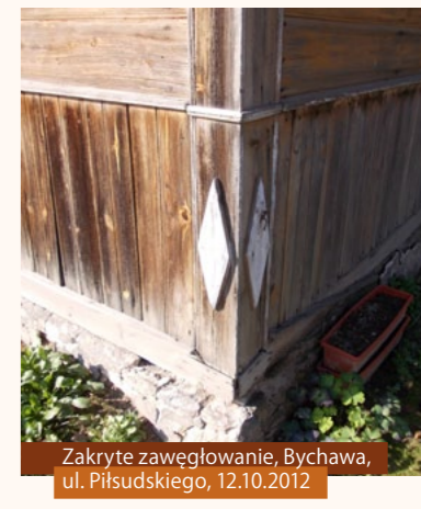
Zakryte zawęglowanie, Bychawa, ul. Piłsudskiego, 12.10.2012