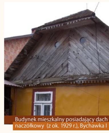
Budynek mieszkalny posiadający dach naczółkowy (z ok. 1929 r.), Bychawka I

Czerwiński T., Budownictwo ludowe w Polsce , Warszawa 2008. Górkę J., Regionalne formy architektury drewnianej Lubelszczyzny na tle zagadnień osadniczych , Zamość 1994. Staszczak Z., Budownictwo chłopskie w województwie lubelskim (w XIX i XX wieku) [w:] „Prace i Materiały Etnograficzne”, t. XXIV., Wrocław 1963. www.dziedzictwopolskiej.pl (20.06.2013)