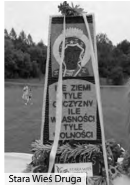
Stara Wieś Druga