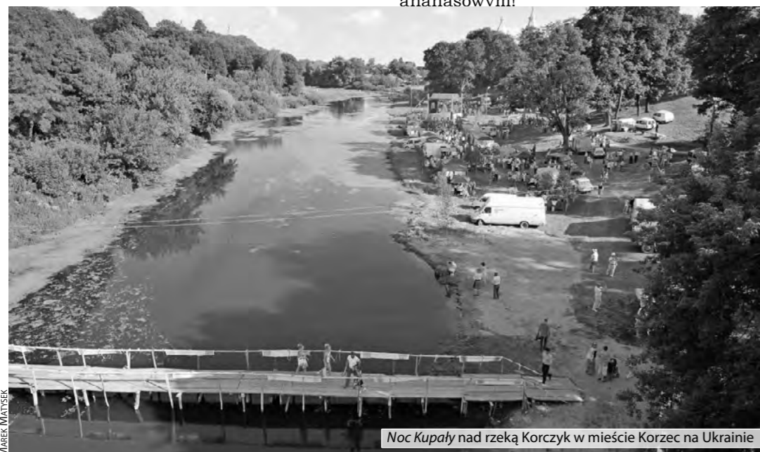
Noc Kupały nad rzeką Korczyk w mieście Korzec na Ukrainie

Budynki kontrastują ze lśniąącym w słońcu złotem dachów cerkwi górujących nad wsiami i miasteczkami.