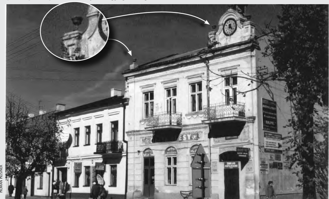
Fotografia sprzed 2006 roku. Na narożniku dachu dawnej „Jedności” brakuje od kilku lat detali architektonicznych w kształcie ozdobnych dzbanów. Tak oto znikają nieodwracalnie ciekawe detale architektoniczne z naszych zabytków...