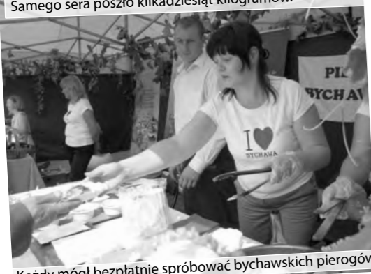
Każdy mógł bezpłatnie spróbować bychawskich pierogów...