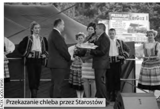
Przekazanie chleba przez Starostów