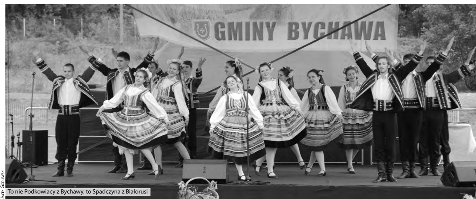
To nie Podkowiacy z Bychawy, to Spadczyna z Białorusi