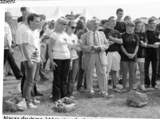
Nasza drużyna, która stanęła do turnieju gmin była (prawie) nie do pokonania. Ogromny sukces odnieśliśmy w konkurencjach: rzut śliskim jajem, sztafeta z burakami, bicie piany i bieg w workach. Nie poszło nam tylko przeciąganie liny, stąd czwarte miejsce.