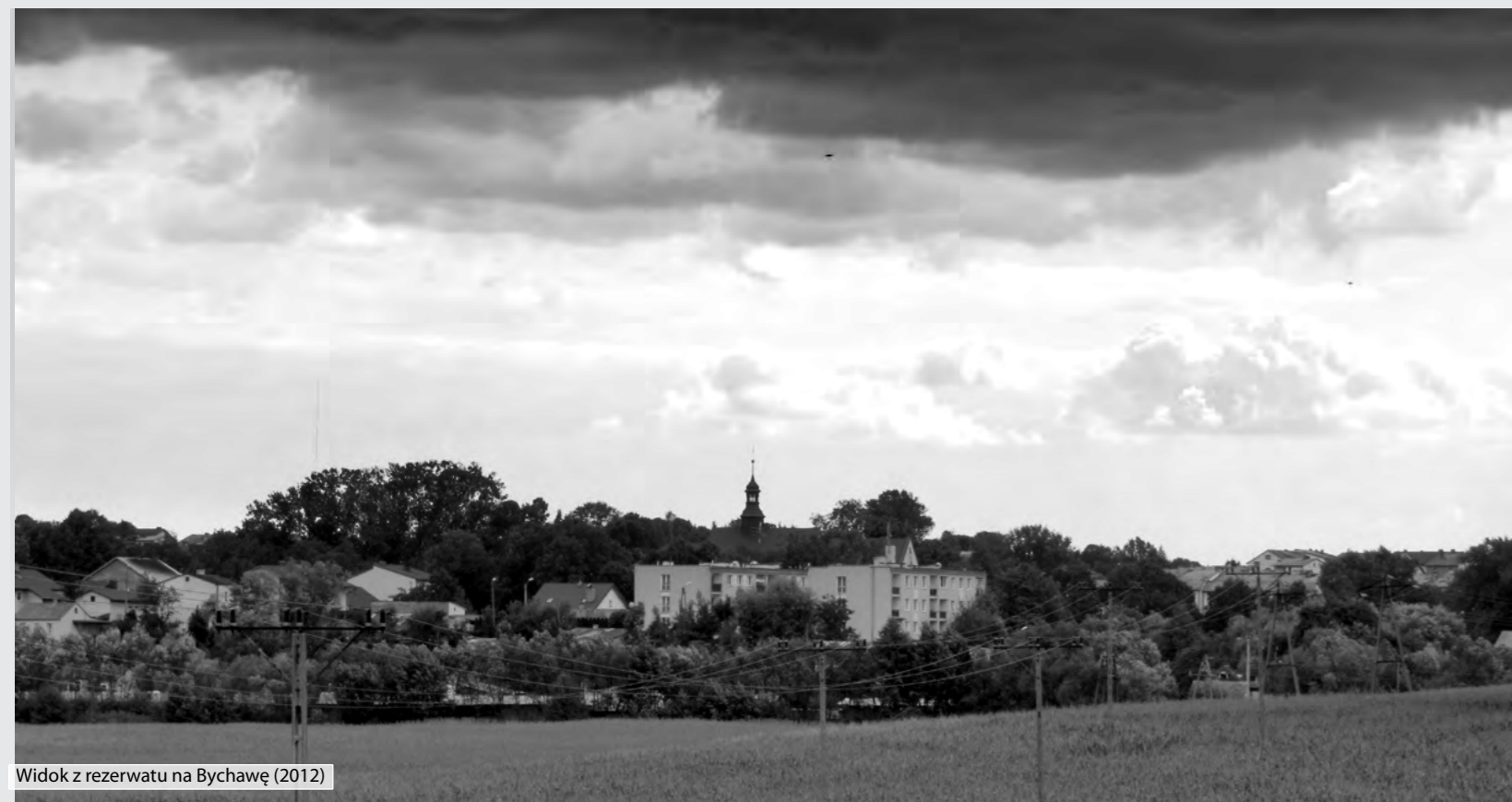
Widok z rezerwatu na Bychawę (2012)

Szczegółowe informacje prześlemy Czytelnikom w następnym numerze „GR”.