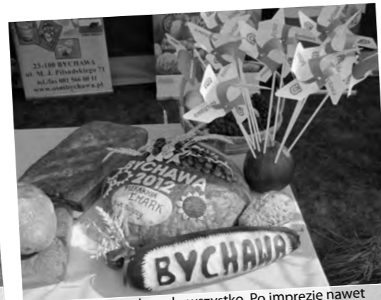
Podobało się i smakowało wszystko. Po imprezie nawet elementy dekoracji (cukinie, kabaczki, słoneczniki) znalazły amatorów.