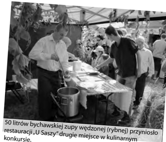
50 litrów bychawskiej zupy wędzonej (rybnej) przyniosło restauracji „U Saszy” drugie miejsce w kulinarnym konkursie.