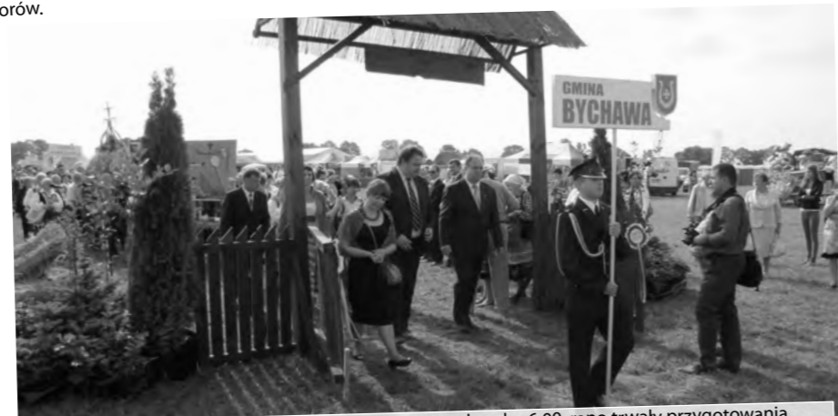
O godz. 10.30 przekroczyliśmy dożynkową bramę, a od godz. 6.00 rano trwały przygotowania. To był dla nas bardzo długi i bardzo pracowity dzień!