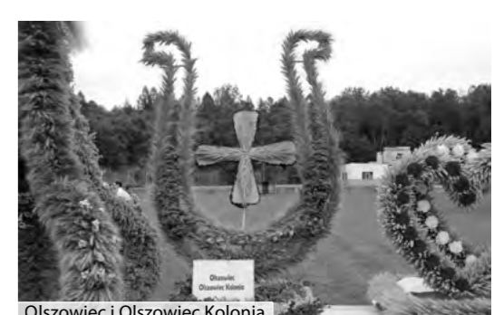
Olszowiec i Olszowiec Kolonia