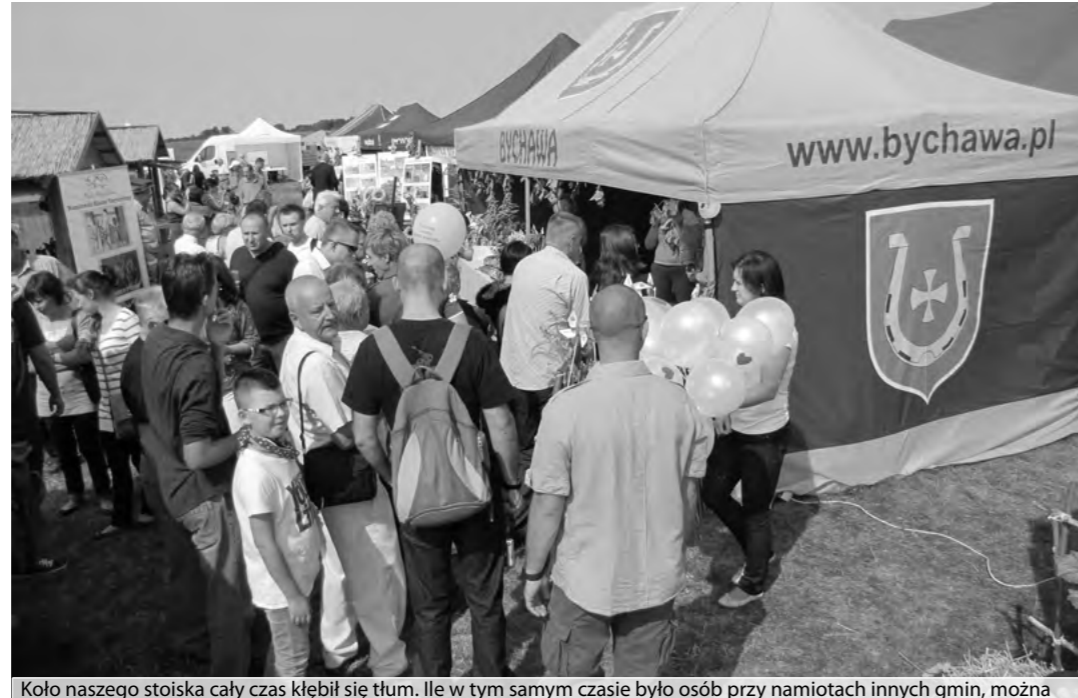
Koło naszego stoiska cały czas kłębił się tłum. Ile w tym samym czasie było osób przy namiotach innych gmin, można zobaczyć na stronie internetowej Bychawa.pl.

Gmina Bychawa nie wtopiła się w szary tłum na dożynkach powiatowych w Radawcu 2 września. Bychawskie stoisko odwiedziło kilka tysięcy zwiedzających, zostało zjedzonych 4000 bychawskich pierogów, poszło ponad 1000 kromek chleba ze smalcem. Rozdano 500 promocyjnych baloników i wiatraczków, 500 kawałków ciasta i pierogów drożdżowych