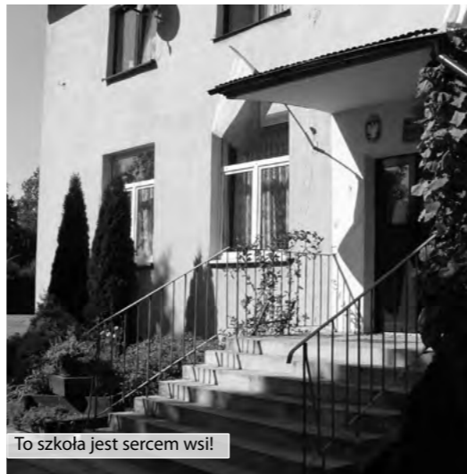
To szkoła jest sercem wsi!