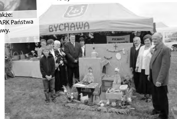
Gałęzów, który reprezentował naszą gminę na dożynkach podbił serca członków komisji w konkursie wieńców – nasi przedstawiciele otrzymali trzecie miejsce. Do rywalizacji przystąpił także wieńiec mieszkańców Grodzan w kategorii wieńiec tradycyjny.