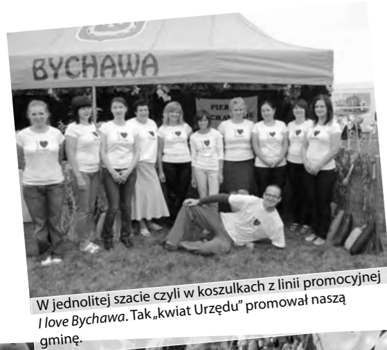
W jednolitej szacie czyli w koszulkach z linii promocyjnej I love Bychawa. Tak „kwiat Urzędu” promował naszą gminę.