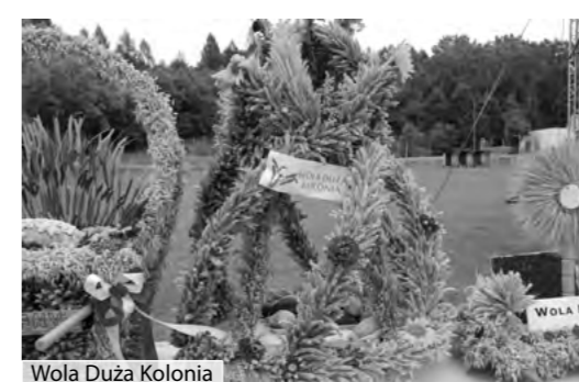
Wola Duża Kolonia