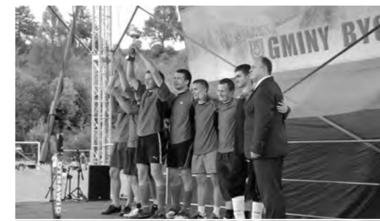
Drużyna z Zaraszowa zdobyła Puchar Burmistrza Bychawy

Na tegorocznych dożynkach gminnych nie zabrakło również akcentów sportowych, bo grzechem byłoby niewykorzystanie naturalnych możliwości jakie stworzył plac – stadion. Od godziny 11 do 17 na boisku treningowym został rozegrany II Turniej Sołectw w Piłkę Nożną o Puchar Burmistrza Bychawy, w którym udział wzięło 9 drużyn: z Gałęzowa, Gałęzowa Kolonii Drugiej, Zaraszowa, Woli Dużej Kolonii, Woli Gałęzowskiej, Grodzan,