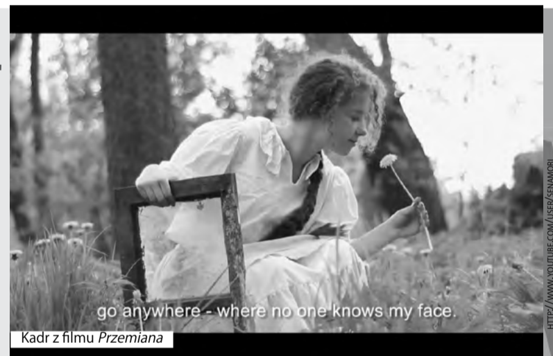
Kadr z filmu Przemiana

Potem, po projekcji filmu Jentl mieliśmy jeszcze ognisko, na którym mogliśmy się lepiej poznać. Nie było ważne jakim językiem mówiliśmy, ani z jakiego kraju pochodziliśmy, wszyscy byliśmy tacy sami i to właśnie stworzyło tak niesamowitą atmosferę.