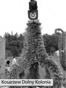
Kosarzew Dolny Kolonia