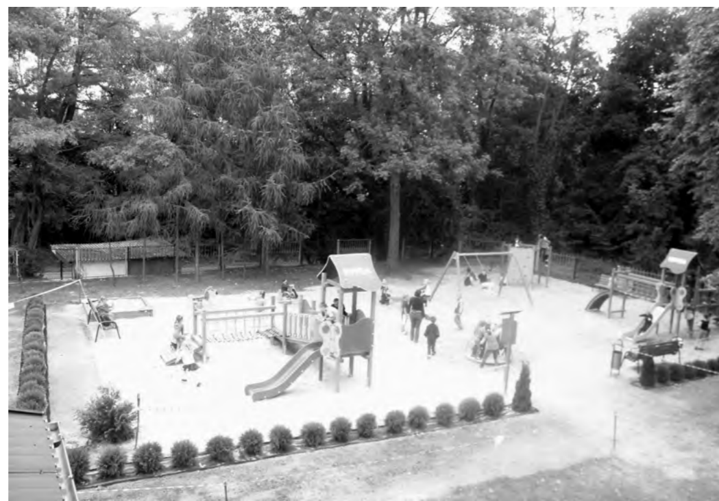
Okładka: Dzieci ze Szkoły Podstawowej w Bychawce na nowym placu zabaw

Serdecznie zapraszamy na uroczyste otwarcie „Placu Zabaw NIVEA” przy Szkole Podstawowej im. Kajetana Koźmiana w Bychawce 20 września o godz. 11.00 .