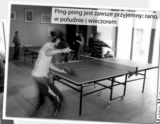
Ping-pong jest zawsze przyjemny: rano, w południe i wieczorem