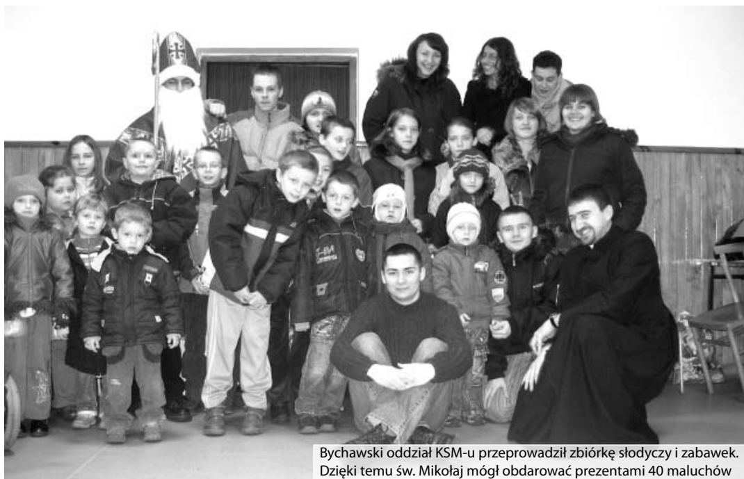
Bychawski oddział KSM-u przeprowadził zbiórkę słodyczy i zabawek. Dzięki temu św. Mikołaj mógł obdarować prezentami 40 maluchów

Należy także wspomnieć o licznych akcjach przeprowadzonych przez nasz oddział. Mam tu na myśli chociażby