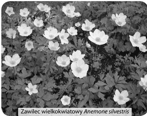
Zawilec wielkokwiatowy Anemone silvestris