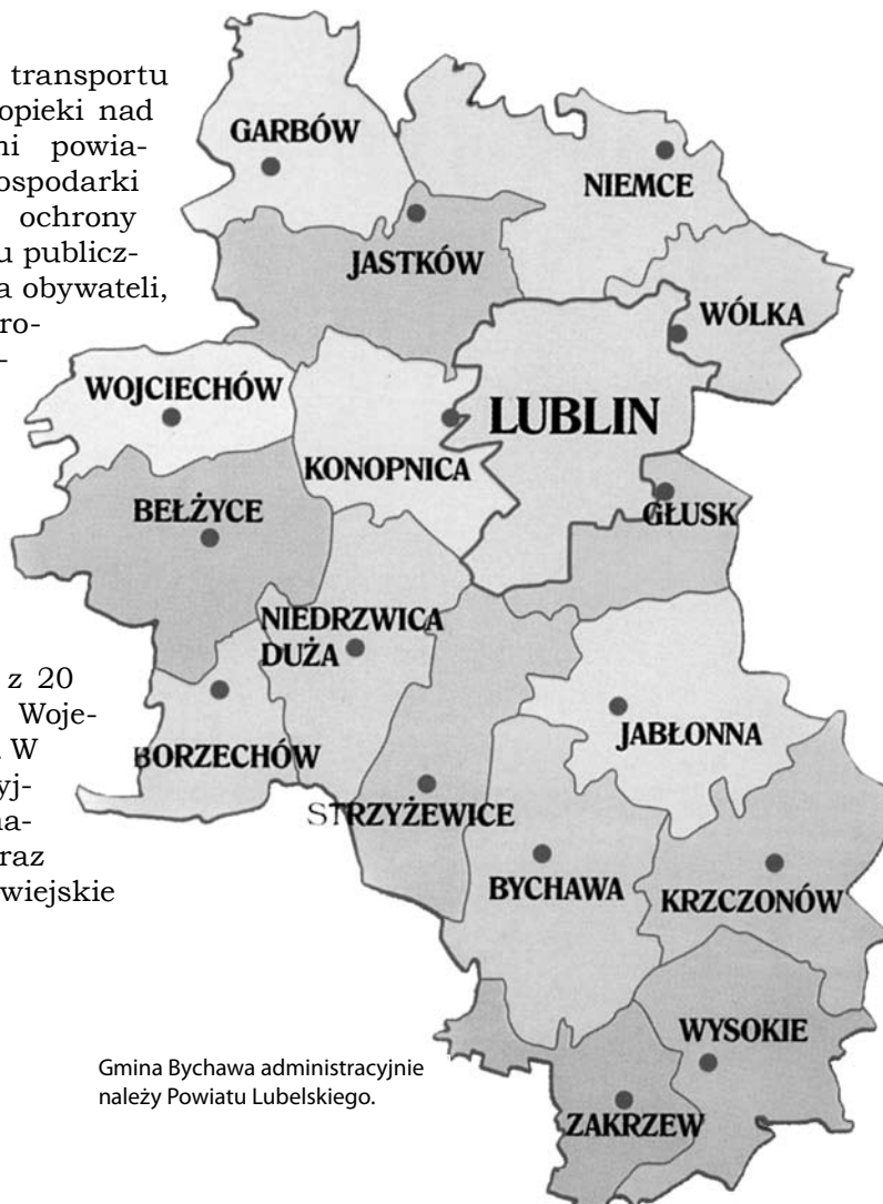
Gmina Bychawa administracyjnie należy Powiatu Lubelskiego.

W Polsce powstało 314 powiatów tzw. „ziemskich”, w tym powiat lubelski. Powiat lubelski jest najludniejszym i jednym z największych z 20 ziemskich powiatów Województwa Lubelskiego. W sensie administracyjnym tworzy go czternaście gmin wiejskich oraz dwie gminy miejsko-wiejskie (Bychawa i Bełżyce).