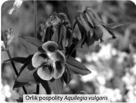
Orlik pospolity Aquilegia vulgaris

stanowią skały węglanowe, a gleby rędziny, lessy, gleby brunatne. Właściwe odwodnienie zapewnia ukształtowanie terenu i spękania skał odprowadzające wodę w głąb ziemi.