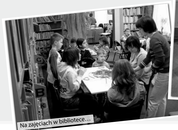
Na zajęciach w bibliotece...