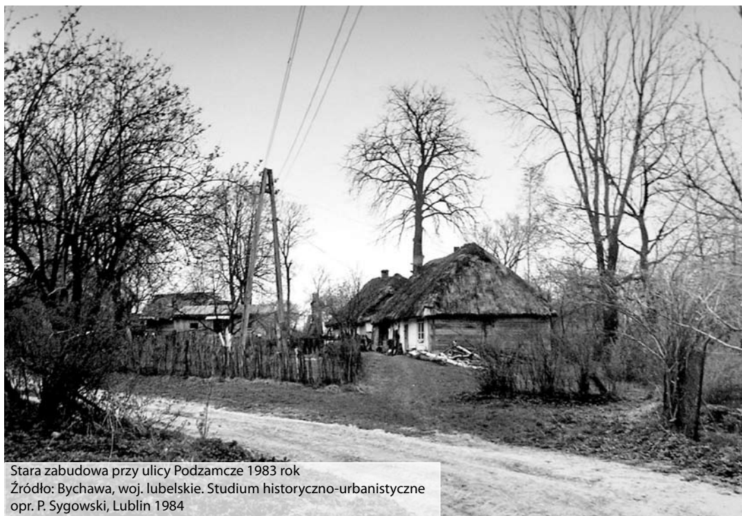
Stara zabudowa przy ulicy Podzamcze 1983 rok

W Polsce roślinność sucha i ciepłolubna (kserotermiczna) występuje płatami na Podkarpaciu, Wyżynie Lubelskiej, Wyżynie Krakowsko-Częstochowskiej i w Niecce Nidziańskiej. Jej siedliskiem są nasłonecznione stoki lub wierzchowiny, zbocza wąwozów, ostańce. Podłoże