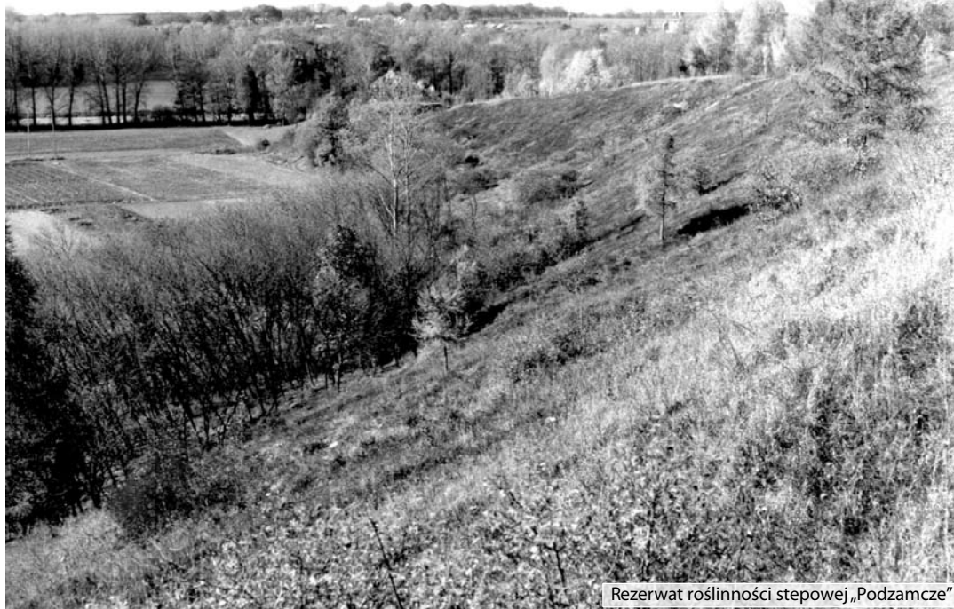
Rezerwat roślinności stepowej „Podzamcze”

Oto relacja mieszkańca Podzamcza: Stawy spuszczone a okoliczni mieszkańcy łapali ryby dźgając je widłami w przepławkach. Zgroza panie brała parcie. Zjedli ile dali rade usmażyć, resz-