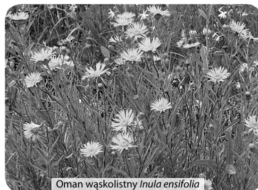
Oman wąskolistny Inula ensifolia

I to jest błąd. Dla zbiorowisk trawiastych umiarkowane deptanie i wypas są dobrodziejstwem – chronią je przed sukcesją lasu. Idąc krawędzią ku wschodowi łatwo zauważymy, że na obszar skarpy wkraczą drzewa. Zjawisko dostrzec możemy także porównując zdjęcia rezerwatu sprzed lat. Modrzew, robinia (potocznie zwana akacją), jesion – głównie u podnóża skarpy, dąb, sosna etc. występują zwłaszcza w żłebach rozcinających zbocza, gdzie więcej wilgoci. Dlatego część drzew i zarosli winna być