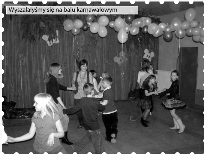
Wyszałałyśmy się na balu karnawałowym

I dlatego, w czwartek, 12 lutego, wybrałyśmy się najlepszą zabawę karnawałową do BCK.