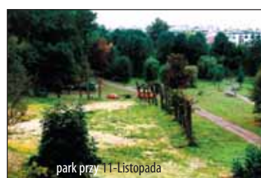
park przy 11-Listopada