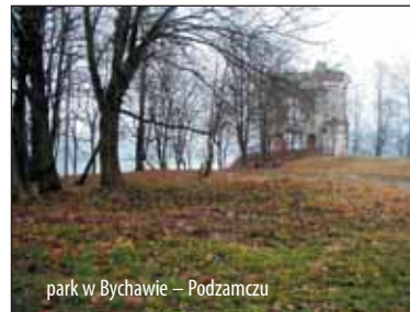
park w Bychawie – Podzamczu

ul. Marszałka Piłsudskiego obejmowały m.in.: