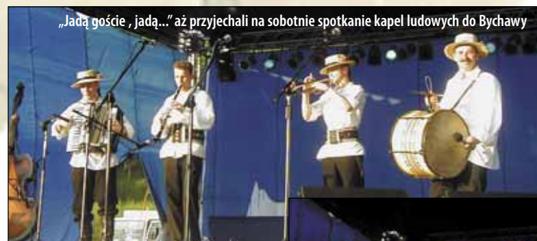
„Jadą goście, jadą...” aż przyjechali na sobotnie spotkanie kapel ludowych do Bychawy