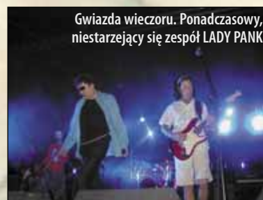
Gwiazda wieczoru. Ponadczasowy, niestarzejący się zespół LADY PANK

To, co mnie zasmuciło najbardziej, jako biednego studenta, to wiadomość, że bilety, podobnie jak rok temu, będą jednorazowe. Dlatego po wielu rachunkach prawdopodobieństwa z rozkładem jazdy zamieszczonym w GZB dokładnie wszystko przekalkulowałem. Imprezę otwiera Delfin, zamyka – Lady Pank, w międzyczasie obiad