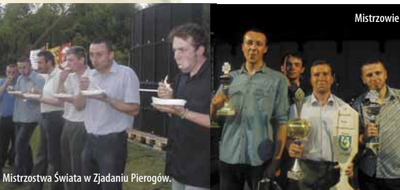
Mistrzostwa Świata w Zjadaniu Pierogów.

W czasie strojenia się gwiazdy wieczoru odbyła się najważniejsza chyba część programu. Mistrzostwa Świata z Zjadaniu Pierogów. Przystąpiło do nich piętnastu smakoszy, między innymi ubiegło-