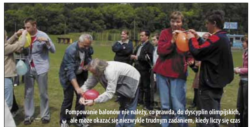
Pompowanie balonów nie należy, co prawda, do dyscyplin olimpijskich, ale może okazać się niezwykle trudnym zadaniem, kiedy liczy się czas

Z całą pewnością tak. A spotkać można ich było nie dawno w naszym mieście, w którym już po raz trzeci odbyła się wojewódzka Spartakiada Środowiskowych Domów Samopomocy. Wzięło w niej udział piętnaście tego typu instytucji z Lublina, Puław, Łęcznej, Matczyna, Krasnegostawu, Radzyna Podlaskiego, Annopola, Poniatojew, Lubartowa, Lasek, Białej Podlaskiej, Tarnobrogu i oczywiście z Bychawy.