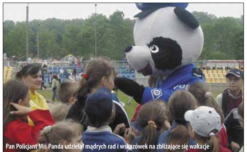
Pan Policjant Miś Panda udzielał mądrych rad i wskazówek na zbliżające się wakacje