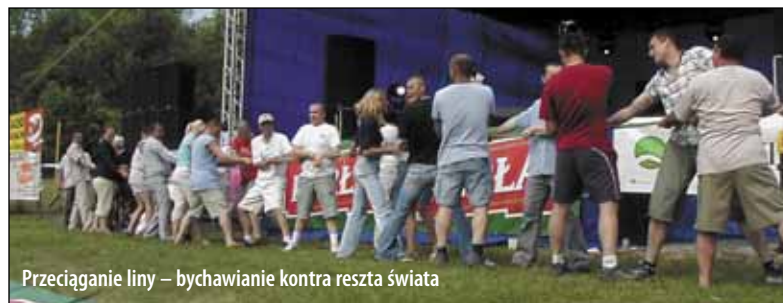
Przeciąganie liny – bychawianie kontra reszta świata