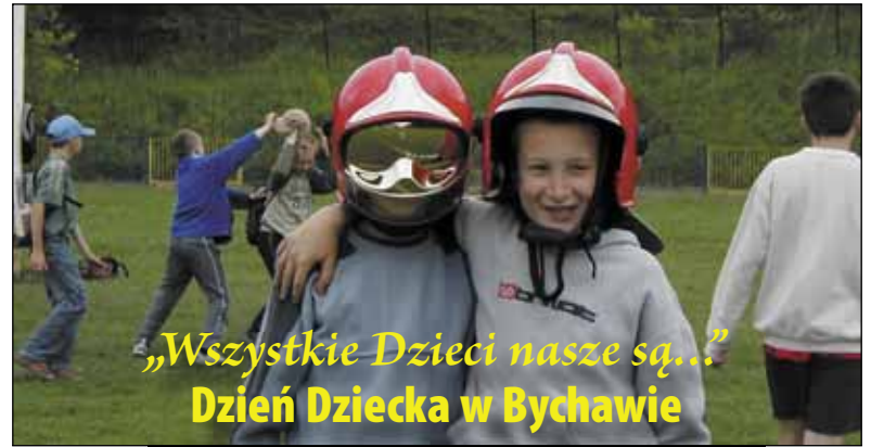
„Wszystkie Dzieci nasze są...” Dzień Dziecka w Bychawie

Polykanie ognia, stąpanie po szklach i gwoździach, akrobatyczna jazda rowerem, niesamowite magiczne sztuczki ... a wszystko to okraszone humorem przesympatycznego klauna ze Lwowa, który od pierwszego wejrzenia zdobył serca wszystkich dzieci. Oprócz tego wesołe miasteczko, smakowite kiełbaski z grilla, dla odważnych konkursy na scenie, oczywiście z nagrodami. Dla swoich fanów wystąpił Kogel-Mogel.