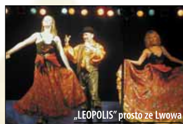
„LEOPOLIS” prosto ze Lwowa

ty na dwa dni. Sobota upłynęła pod hasłem „Biesiadna Bychawa”, a gwoździem programu były spotkania kapel ludowych po raz pierwszy na skalę całego województwa lubelskiego. Występowały zespoły z naszego miasta i okolic, rozpalone zostało biesiadne ognisko. Wieczorem wystąpiła rewia Leopoldis prosto ze Lwowa oraz zespół Skaner.