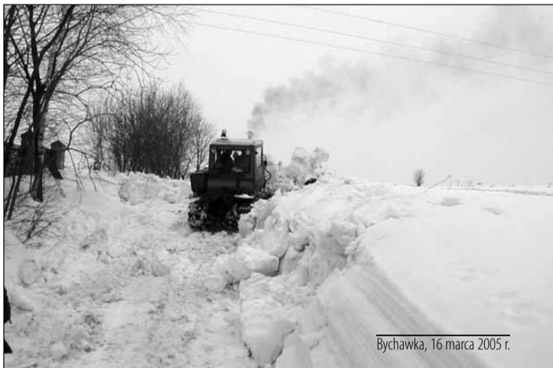
Bychawka, 16 marca 2005 r.

Co prawda zapachniało już wiosną, ale jeszcze kilka dni temu borykaliśmy się z trudnościami, których przysporzyła nam uśpiona do tej pory zima. Obfite