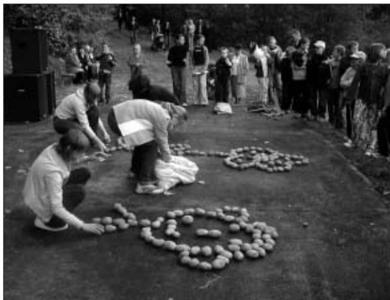
Konkurs na zaprojektowanie ziemniaczanego wzoru

ło znaną i oczekiwaną nie tylko przez dzieci rozrywką i pewnym, niemalże, rytuałem kończącym wykopki.