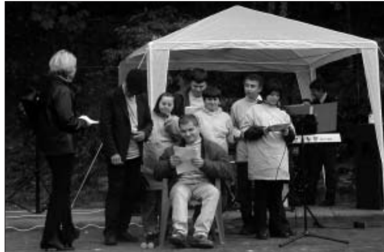
Niepełnosprawni uczestnicy jesiennego festiwalu

29 września do Bychawy przybyły osoby niepełnosprawne z różnych zakątków województwa lubelskiego. Teren parku miejskiego przy ul. 11-go Listopada stał się w tym dniu miejscem integracji dwunastu ośrodków wsparcia dla osób z zaburzeniami psychicznymi.