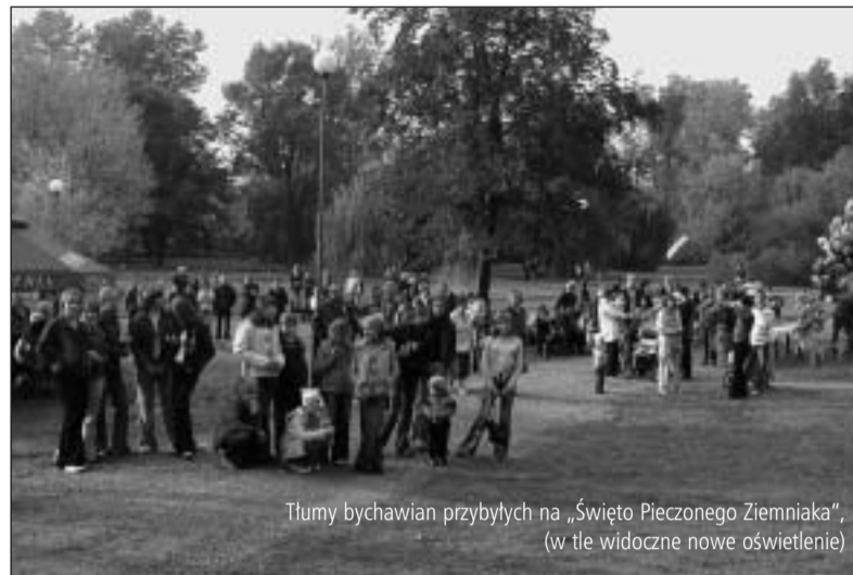
Tłumy bychawian przybyłych na „Święto Pieczonego Ziemniaka”, (w tle widoczne nowe oświetlenie)