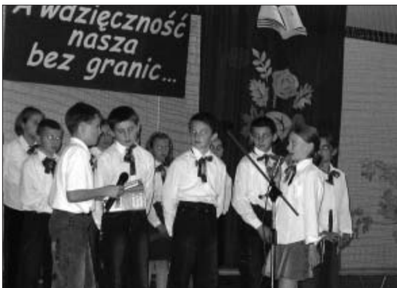
Uczniowie SP im. Kajetana Koźmiana w Bychawce