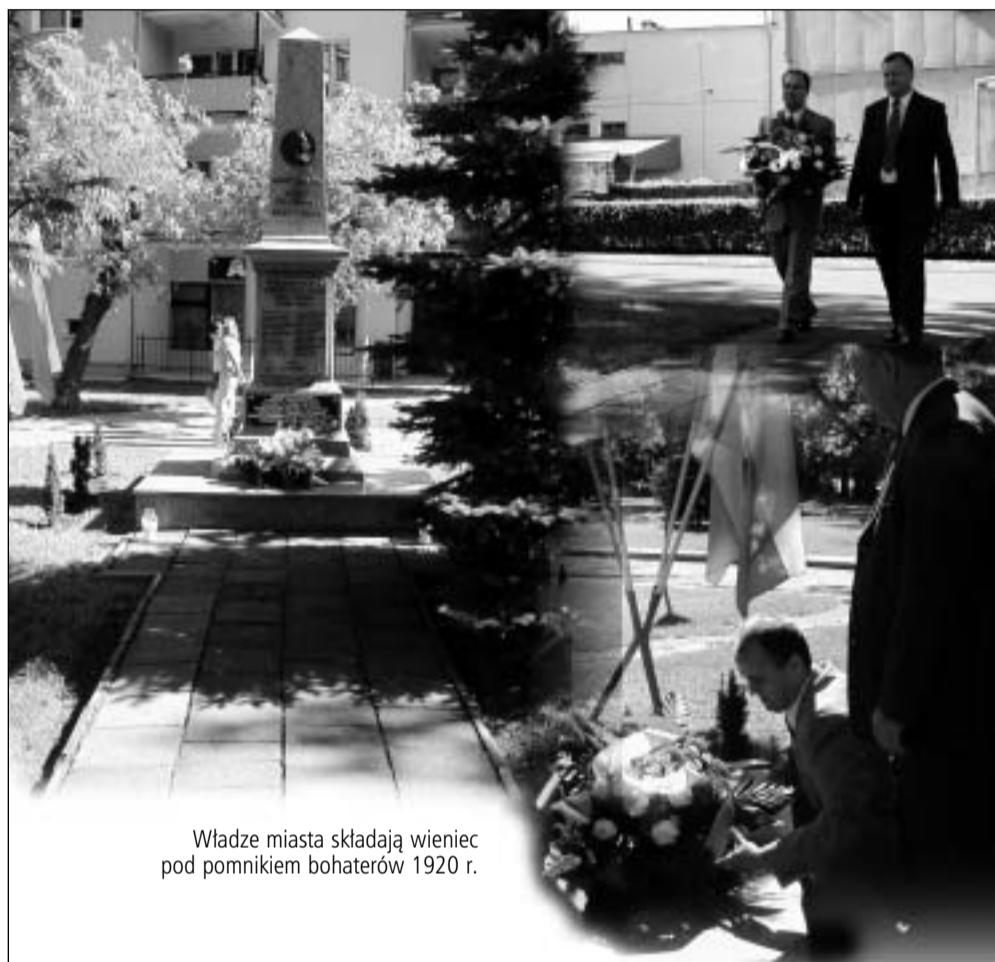
Władze miasta składają wieniec pod pomnikiem bohaterów 1920 r.

Sierpień i wrzesień to szczególne miesiące w historii polskiego narodu i państwa – naznaczone krwią wielu rodaków, którzy w najbardziej dramatycznych i przełomowych momentach naszych dziejów stanęli do służby Ojczyźnie, aby bronić jej wolności. Pierwszy z nich nieodparcie kojarzy się nam ze słynnym „Cudem nad Wisłą”. Młode, świeżo odrodzone, kształtujące się jeszcze terytorialnie i ustrojowo państwo polskie podjęło jesienią 1918 r. walkę o poszerzenie swoich granic na wschodzie. Doprowadziło to do konfliktu najpierw z Ukraińcami, a następnie komunistyczną Rosją Radziecką, której przywódca pragnęli urzeczywistnić ideę „czerwonego marszu” na zachód Europy. Po pierwszych