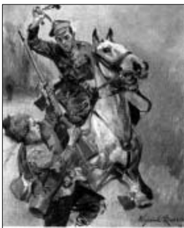
Wojciech Kossak „Starcie ułana z piechurami 1927”