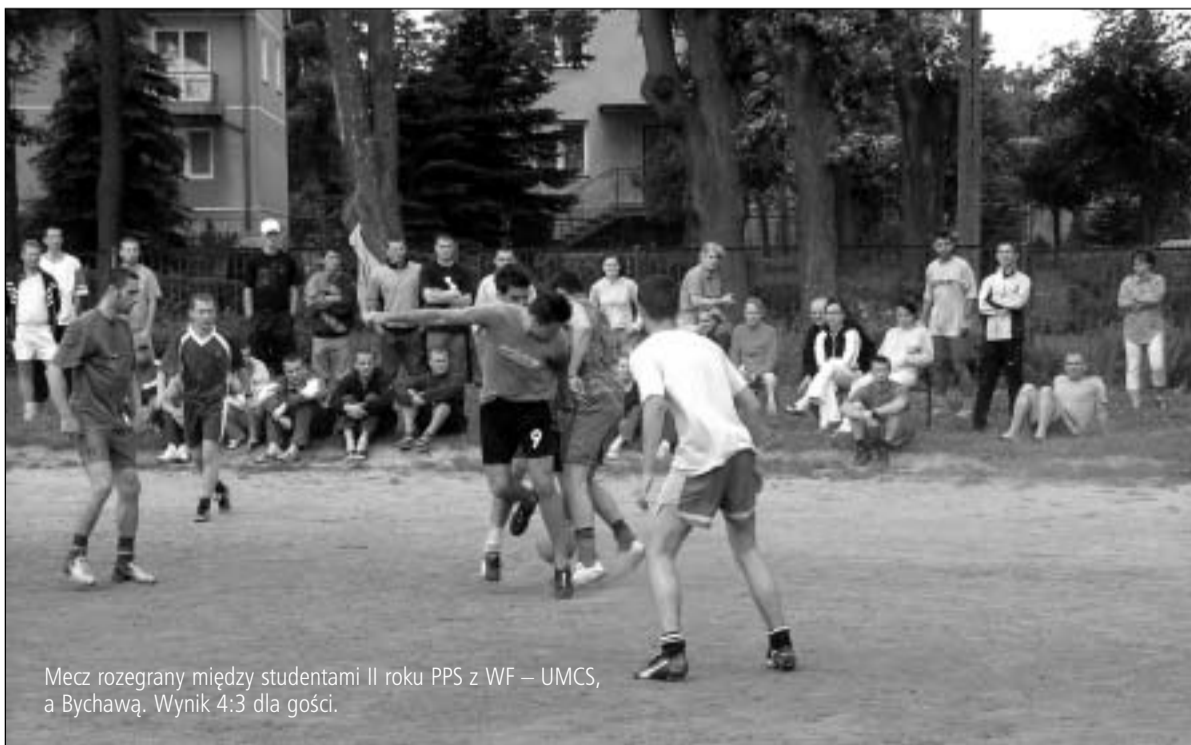
Mecz zegrany między studentami II roku PPS z WF – UMCS, a Bychawą. Wynik 4:3 dla gości.

Jak na każdym obozie, tak i na tym, obowiązywał regulamin, a także ściśle przestrzegany program i rozkład zajęć, nad realizacją którego czuwała Rada Pedagogiczna. Dyscypliny sportowe, które zakładał program to m. in. pływanie, lekka atletyka terenowa, zabawy i gry terenowe, tańce