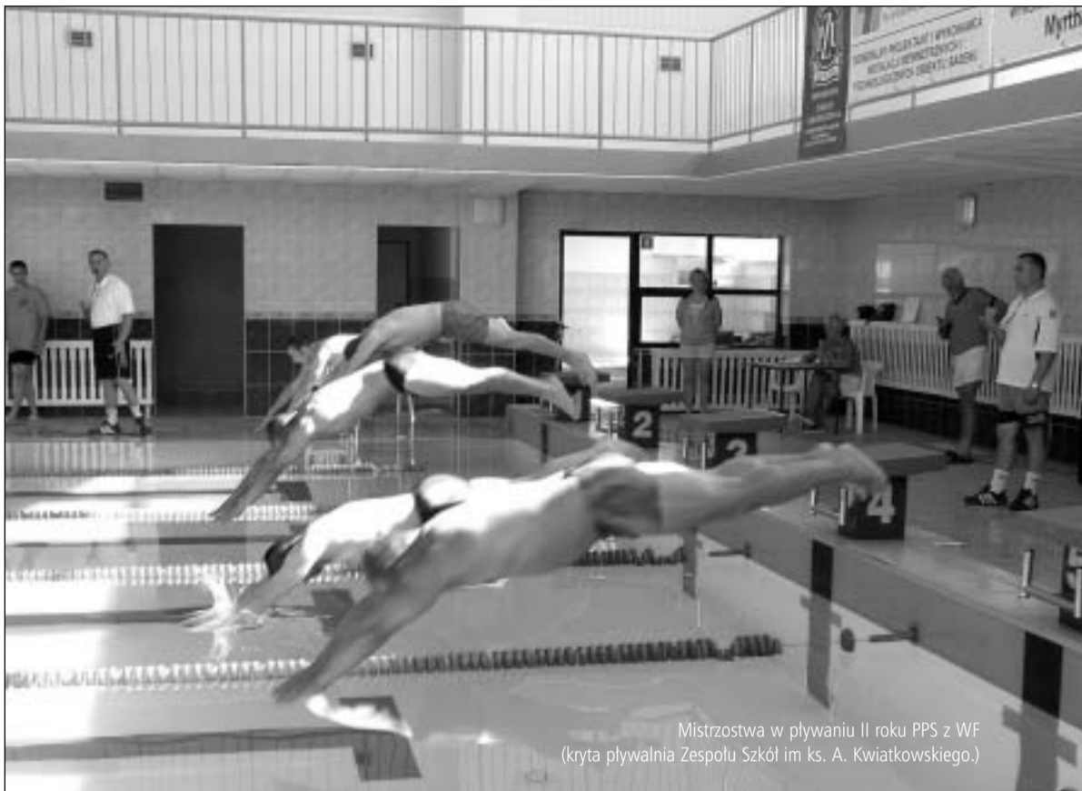
Mistrzostwa w pływaniu II roku PPS z WF (kryta pływalnia Zespołu Szkół im ks. A. Kwiatkowskiego.)