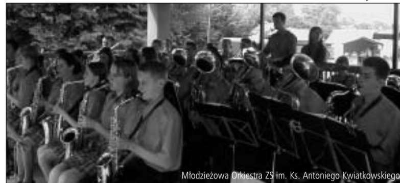
Młodzieżowa Orkiestra ZS im. Ks. Antoniego Kwiatkowskiego