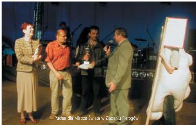
Puchar dla Mistrza Świata w Zjadaniu Pierogów.

impresz w plenerze. O tym decyduje przede wszystkim program, atrakcje, które nie pozwolą się nudzić i dostarczą rozrywki uczestnikom w różnym wieku a także zaspokoją bardziej i mniej wybredne gusta uczestników. Nie jest to łatwe, ale w tym roku śmiało można stwierdzić, że organizatorzy temu sprościli. Na najmłodszych czekały karuzele, zjeżdżalnie, dmuchane zamki, konkursy, wspólne malowanie plakatu „W krainie pierogów”, występy rówieśników na scenie (Kajetanki, Kogel – Mogel), cukrowa wata, baloniki i zabaweczki z kolorowych „jarmarkowych” stoisk. A dorosli? I tu rozrywek było bez liku. Koncentrując się na scenie: gwiazda muzyki disco polo zespół AK-CENT, gorące rytmy w wykonaniu