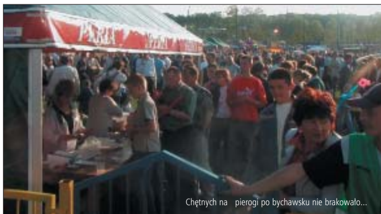
Chętnych na pierogi po bychawsku nie brakowało...

W niedzielę 30 maja zdecydowanie „przejaśniło się” – zaświeciło słońce i wreszcie piękna majowa pogoda powitała przybywających coraz liczniej od samego rana na stadion sportowy w Bychawie uczestników imprezy. Wiadomo, że nie tylko słońce jest gwarancją sukcesu i dobrej zabawy w przypadku