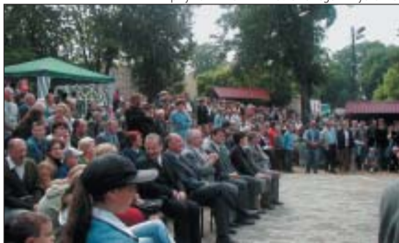
Licznie zgromadzeni uczestnicy Festiwalu w Amfiteatrze przy ZS im. Ks. A. Kwiatkowskiego w Bychawie.

ca nasze lokalne święta i uroczystości, nominowana do tytułu Ambasadora Województwa Lubelskiego, rozslawiająca Bychawę w całym kraju, poza jego granicami, a nawet za oceanem... czyli Młodzieżowa Orkiestra Dęta ZS im. Ks. A. Kwiatkowskiego w Bychawie.