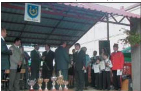
Wspaniały występ gościa Festiwalu - Góralskiej Orkiestry Dętej z Łącka na długo pozostanie w pamięci bychawian.