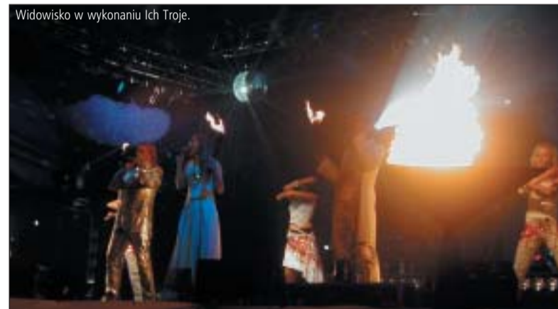
Widowisko w wykonaniu Ich Troje.

PÓW -choć nie były tak spektakularne jak poprzednie. Tu nie