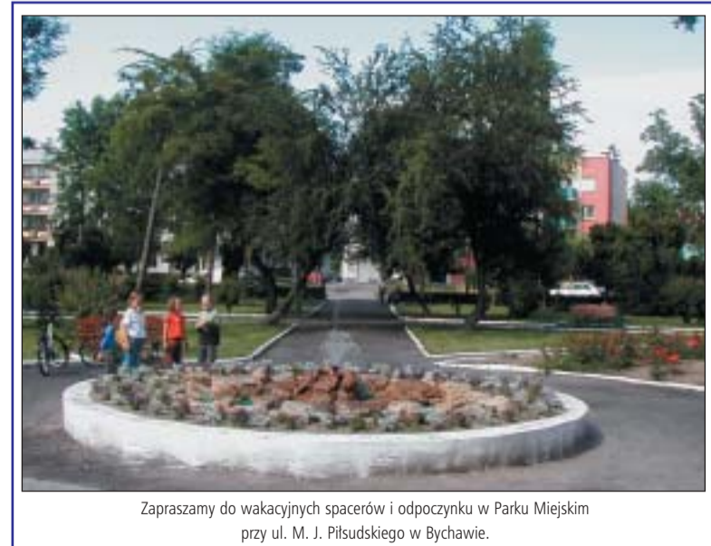
Zapraszamy do wakacyjnych spacerów i odpoczynku w Parku Miejskim przy ul. M. J. Piłsudskiego w Bychawie.